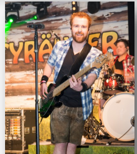
Kurz vor dem Verschwinden der Bass-Gitarre