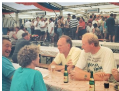
1. „Heenskirmes“ 1993