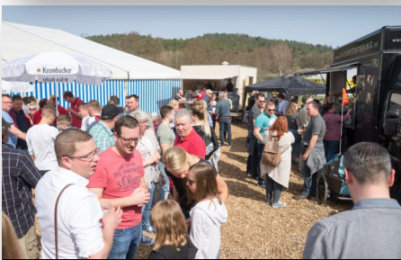
Bestes Wetter beim Food-Truck Event