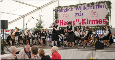
Auch diese mal wieder dabei: die Stadtkapelle Wetter