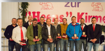
Ehrung für 30-Jahre Mitgliedschaft