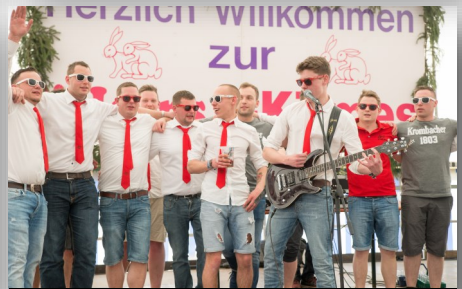
Der „alte“ Festausschuss beim Grande Finale